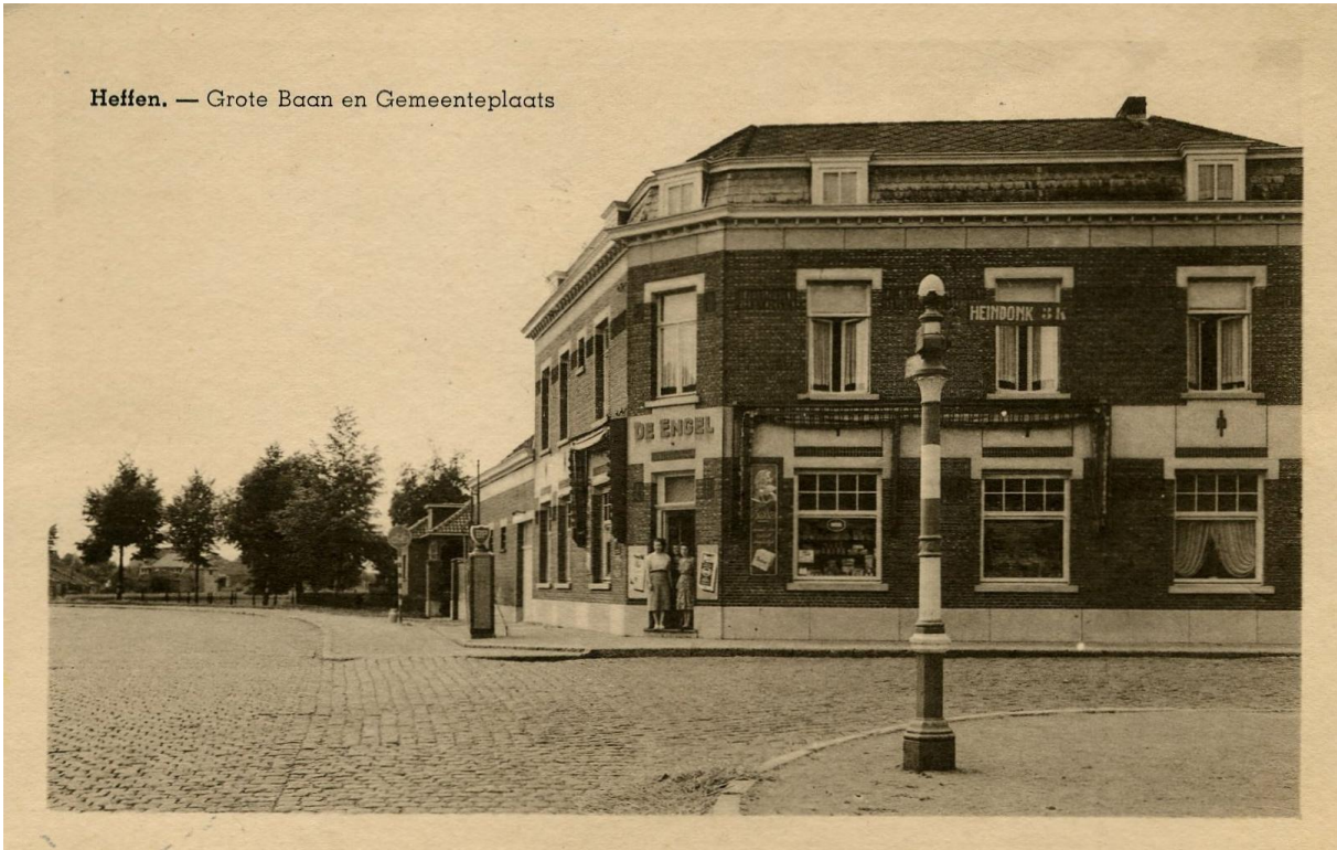
Heffen. — Grote Baan en Gemeenteplaats